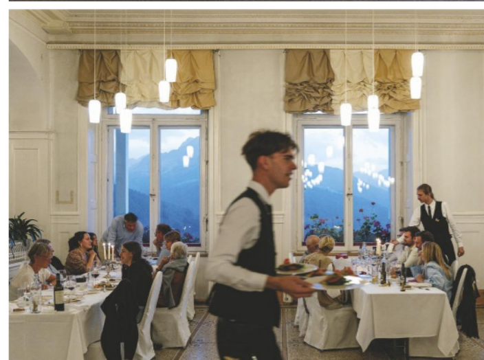
Bergblick: Auch wer kein Hotelgast ist, kann im haus-eigenen Restaurant „Belle Epoque“ speisen (u.)

S o muss er gelegen haben, denke ich. Schräg fällt die Sonne auf den Balkon, auf meine mit einer Decke umwickelten Beine. Die Liege ist aus Bambus, die Lehne halb erhöht. Über den Bergrücken stehen bauschige Wolken, als warteten sie darauf, mir meine Gedanken abzunehmen. Ich muss sie nur loslassen. Schwalben stürzen lautlos in die Tiefe, steigen auf, stürzen ab, immerzu. Nichts als der wandernde Schatten verrät mir, dass die Zeit verstreicht. Stunden haben sie so verbracht, denke ich. Die Gesunden und Todgeweihten und jene, die um sie bangten. Auch er, Hans Castorp. Auch er wird auf baumlose Bergrücken geschaut haben, die unverändert dort liegen und vom Ewigen erzählen. Bis ein Arzt durch die Seitentür trat, den Puls fühlte, plauderte.